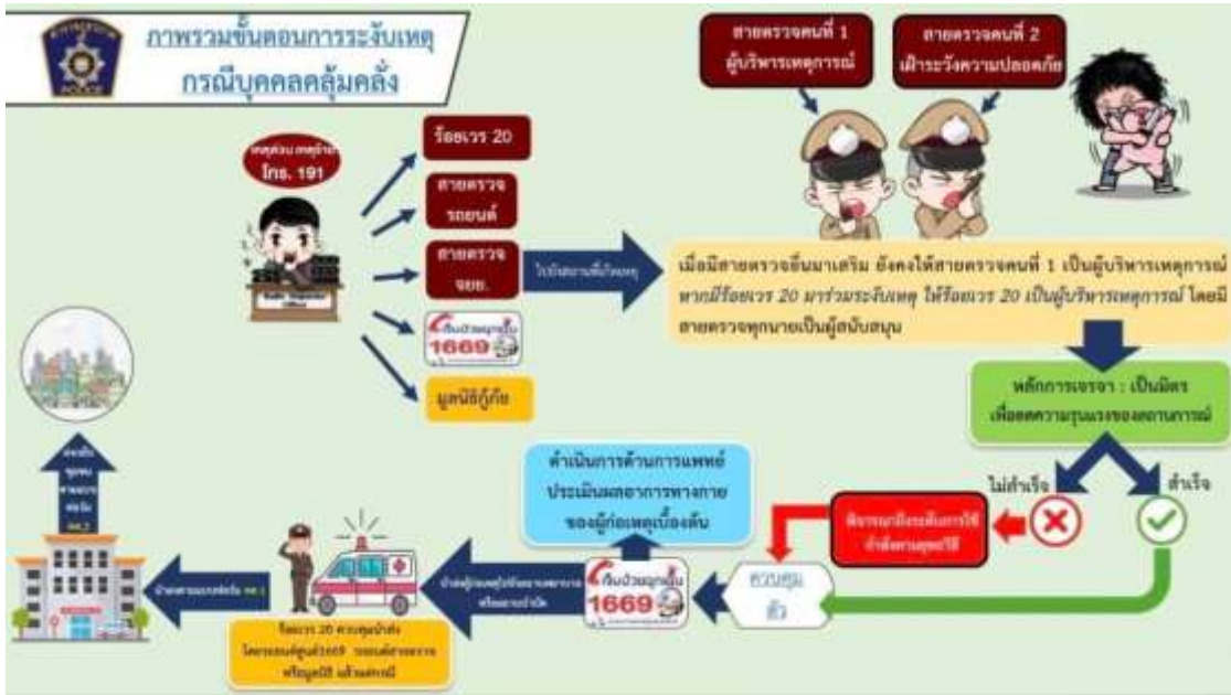
ภาพที่ 3 ภาพรวมขั้นตอนการระงับเหตุกรณีบุคคลลุ่มคลั่ง