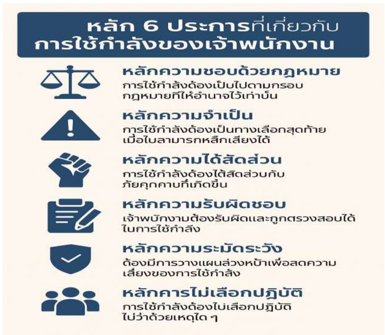
ภาพที่ 6 คู่มือแนวทางปฏิบัติว่าด้วยกฎการใช้กำลังและอาวุธ

ข้อจำกัดด้านบุคลากรเฉพาะทางการขาดแนวทางการฝึกอบรมเฉพาะด้านในการจัดการกับผู้มีอาการคลุ้มคลั่งที่เกี่ยวข้องกับสารเสพติด และการไม่มีทีมสนับสนุนจิตเวชฉุกเฉินในที่เกิดเหตุ