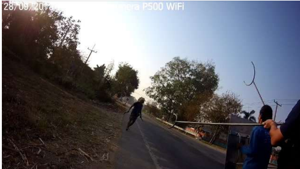
ภาพที่ 4 การเข้าระงับเหตุบุคคลกลุ่มคั้ง

ของทีมเจ้าหน้าที่ตำรวจสายตรวจ ที่มีโล่ ไม้ง่าม ปืนไฟฟ้า และเสียงเจรจา ระหว่างเข้ายับยั้งและจับกุมตัวผู้ก่อเหตุ กลุ่มคั้งถืออาวุธมีดเหรียญตายหญ้าพร้อมจะก่อเหตุทำร้ายร่างกายบุคคลอื่นที่ผ่านไปมาในบริเวณนั้น